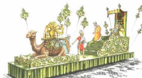
Carroza Rey Gaspar "Trono Elefante"